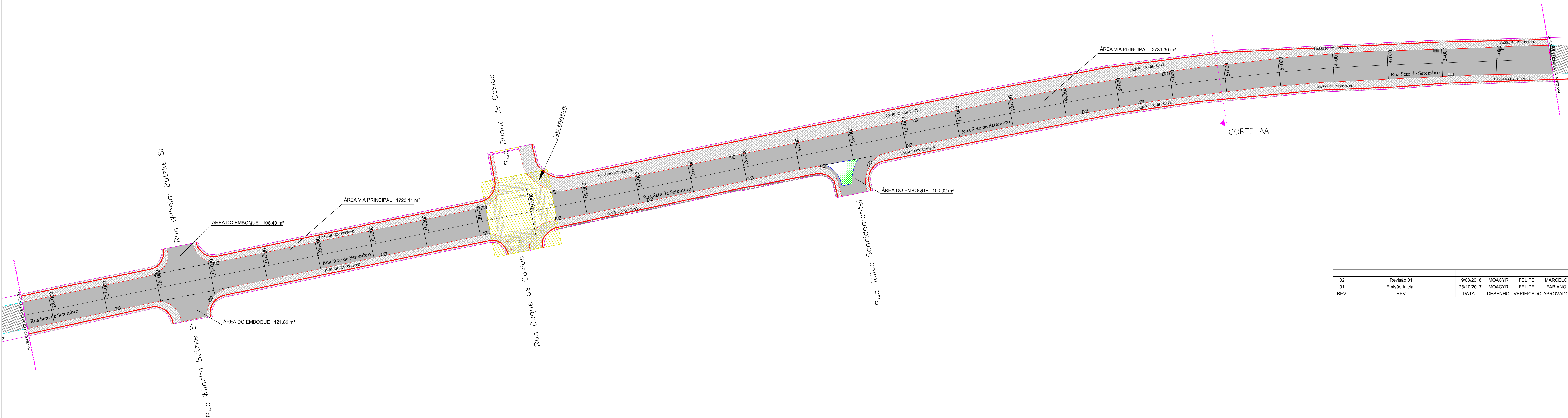
CORTA AA - SENTIDO DO FLUXO SEM ESCALA